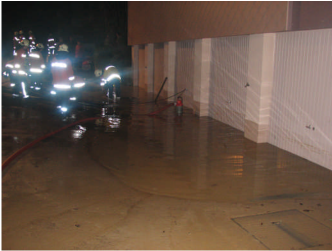
Die Garagen stehen teilweise bis 50 cm unter Wasser.

eine weitere Überflutung der angrenzenden Wohnhäuser verhindert. Aufgebrachte Anwohner müssen betreut und beruhigt werden. Die überfluteten Garagen werden mit Motorspritzen Typ II leer gepumpt.