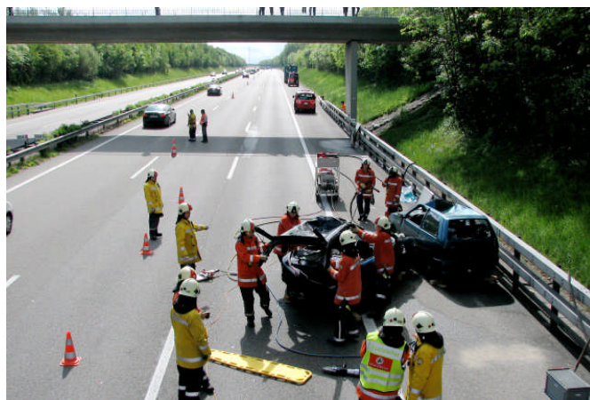
Strassenrettungsübung auf der Autobahn A1.