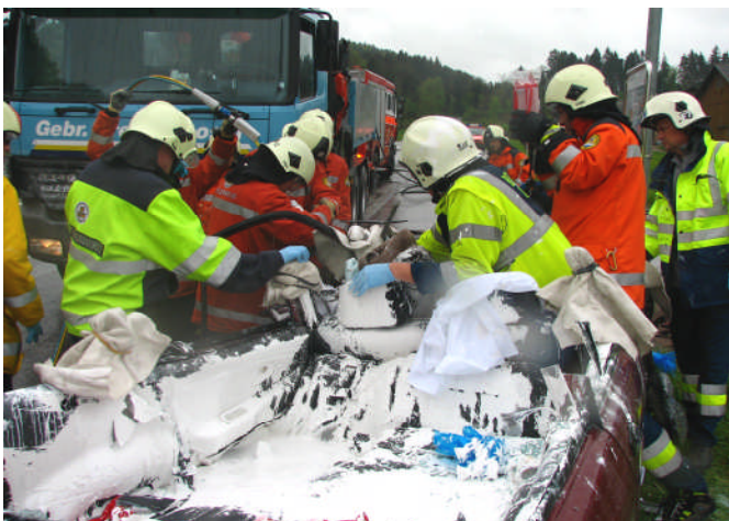
Ausgelaufene Farbe behindert die Rettung.

Ausgangslage: Nach einem Verkehrsunfall zwischen einem Personenwagen und einem Lastwagen auf der Kreuzung Stelz ist der Lenker des Personenwagens eingeklemmt. Der Rettungsdienst ist vor Ort und versorgt den Patienten. Der in der Malerbranche tätige Autolenker hatte im Kofferraum mehrere Kübel Dispersionsfarbe geladen, welche durch den Aufprall geborsten sind und sich überall im Fahrzeug verteilt haben.