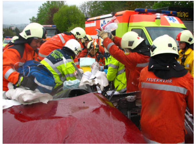
Rettung des Patienten mit vereinten Kräften.

Massnahmen: Infolge zahlreicher Abwesenheiten von Pikettzugehörigen durch Kursbesuch wird sofort durch den Kommando Pikett Offizier die Alst. 2 ausgelöst. Da sämtliche Türen des Fahrzeuges nicht geöffnet werden können und unklar ist, wie weit der Lenker im Fussbereich eingeklemmt ist. In Absprache mit dem Rettungsdienst wird das weitere Vorgehen festgelegt. Nach Erstellen der Strassensicherung wird das Fahrzeug gesichert, vom Sturm abgehängt und anschliessend die Scheiben entfernt. Mit hydraulischem Werkzeug werden das Dach und die Türen abgetrennt. Durch das Entfernen der Fahrertüre wird sichtbar, dass der Lenker im Fussbereich nicht eingeklemmt ist. Für die Verkehrsumleitung hat die Polizei die Feuerwehr Kirchberg Lütisburg aufgeboten. Da beim Einsatz der Kontakt mit der Dispersionsfarbe nicht zu vermeiden ist, wird für die Retablierung von Einsatz- und persönlichem Material viel Zeit in Anspruch genommen.