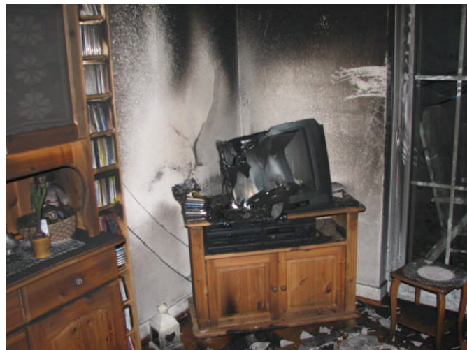
Das Wohnzimmer wurde vollständig verwüstet.

Ausgangslage: Die Feuerwehr wird durch eine Anwohnerin eingewiesen. Diese gibt an, dass es unklar sei, ob sich noch eine Person in der Wohnung befindet. Im Treppenhaus ist im Bereich der betroffenen Wohnungstür schwarzer Rauch sichtbar.